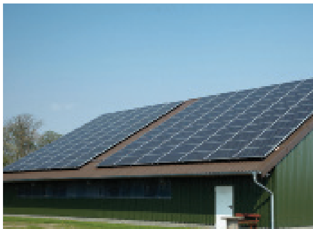
Voorbeeld van een Zonedak

De regeling is bedoeld voor particulieren, zowel huurders als huiseigenaren, maar staat ook open voor bedrijven